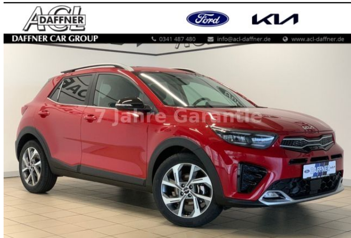
Daffner Car Group | KIA Leipzig