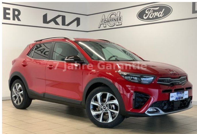
Daffner Car Group | KIA Leipzig