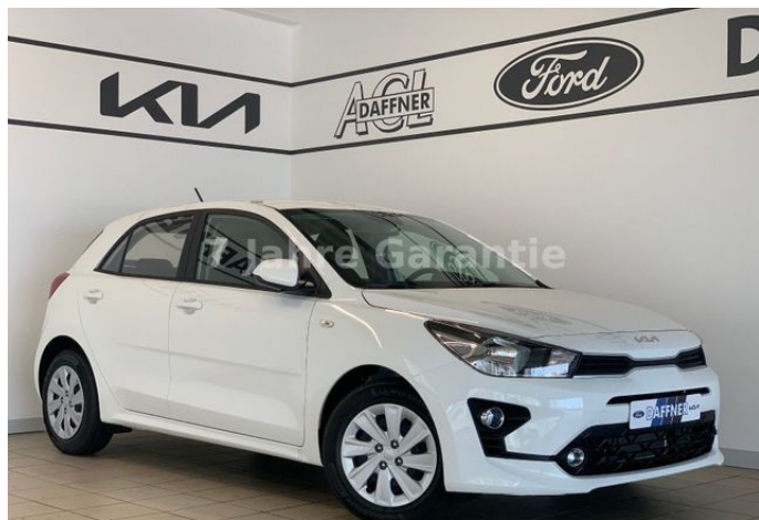
Daffner Car Group | KIA Leipzig