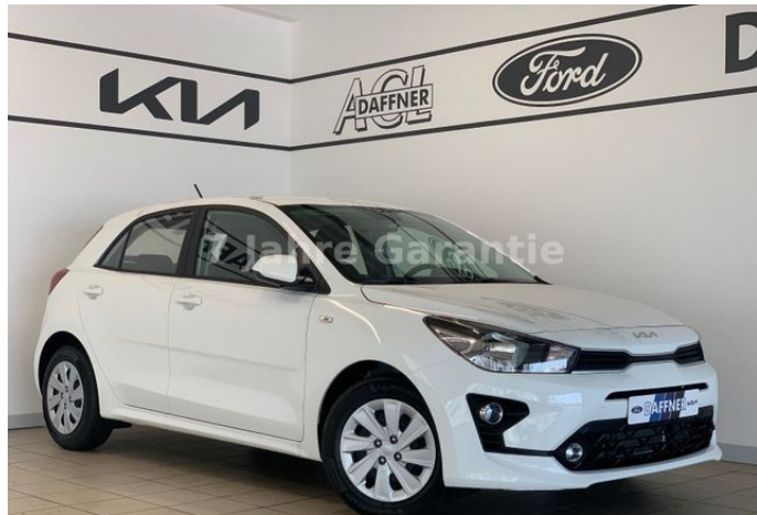
Daffner Car Group | KIA Leipzig