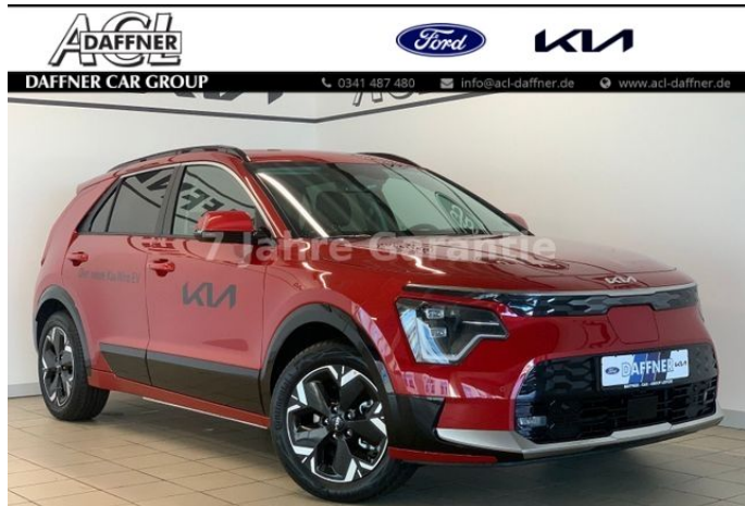
Daffner Car Group | KIA Leipzig